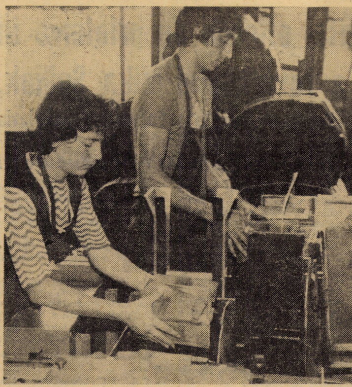
Operația de calibrare a scindurelor, fază pregătitoare pentru linia automată de prelucrare în secția I creioane a I.P.L. Sibiu