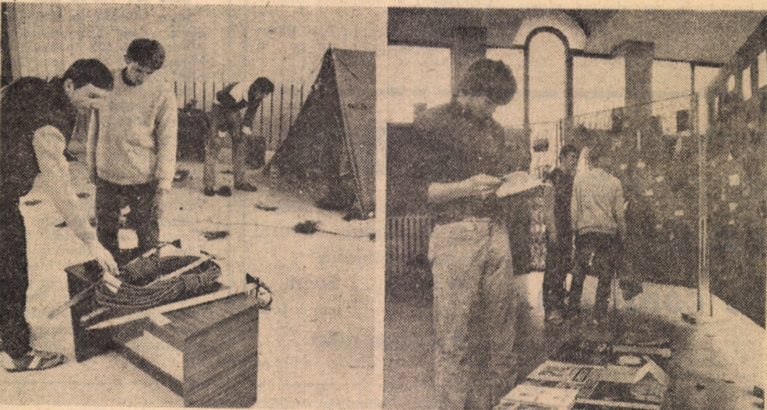
Vernisată în cadrul Festivalului cultural „Toamna sibiană” expoziția de fotografii și materiale turistice s-a bucurat de unanime aprecieri din partea publicului

muncii”; ora 16, seară de diapozitive; ora 17 — festivitate de premii pentru cîștigătorii trofeului „Clopul turistului '83”. Duminică, ora 8 — drumetie pe traseul: Sibiu — Rășinari — Grădina trandafirilor — Valea argintie — Cîsnădioara — Sibiu.