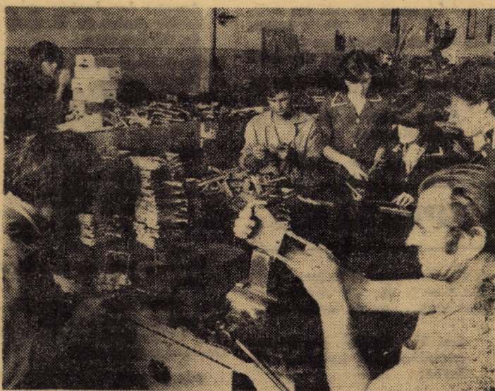
Banda de montaj a cintarelor de gospodărie de 10 kg în atelierul balanțe uz casnic al întreprinderii „Balanța” din Sibiu