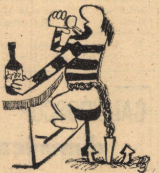
Fără cuvinte Desen de Adrian POPESCU

Unii la serviciu așa înțeleg: — Cînd este de față, de el nu mă jeg! Spiridon ȘTEFĂNESCU