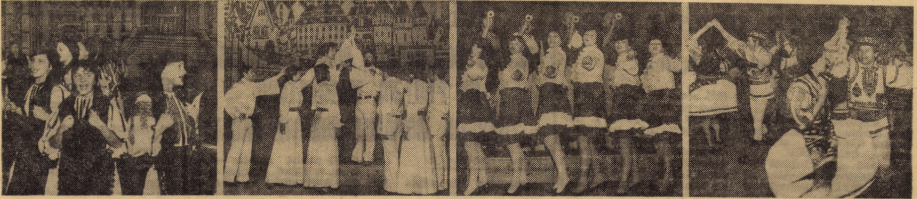
Imagini surprinse de la spectacolul de gală al laureaților celei de a IV-a ediții a Festivalului național „Cîntarea României” pe scena Casei de cultură a sindicatelor din Sibiu.