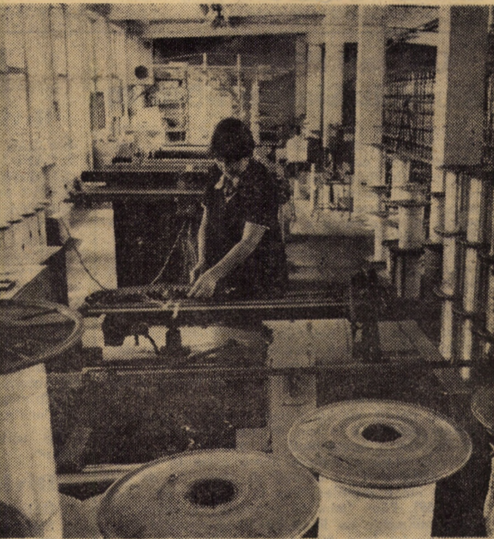
Pregătirea urzelii pentru mașinile rapide de tricotat în secția urzilor a întreprinderii „Drapelul roșu”, Sibiu.

torilor sporul este de 3 și respectiv 5,9 la sută față de nivelul planificat. Productivitatea muncii a cunoscut și ea o creștere de 3,6 la sută peste cifra de plan, iar sporul producției nete este de 5 526 mii lei.