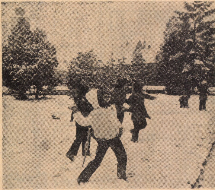
Prima zăpadă — prilej de bucurie pentru cei mici