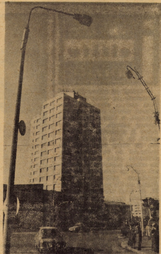
Centrul modernizat al Sibului — o elocventă mărturie a împlinirii socialiste

ORGAN AL COMITETULUI JUDEȚEAN SIBIU AL P.C.R. ȘI AL CONSILIULUI POPULAR JUDEȚEAN