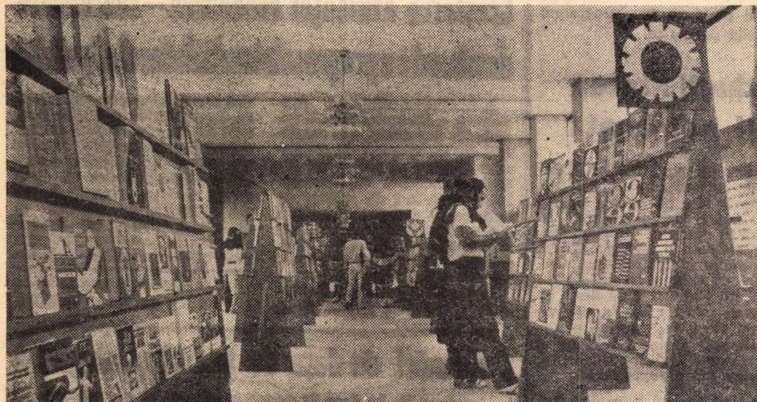
La Salonul județean al cărții din acest an, găzduit de Casa de cultură a sindicatelor în sala de marmură, organizatorii au expus peste 2500 de titluri, din domeniile ideologic, tehnic, și beletristică

este programată o seară de muzică de jazz și proiecții de diapozitive color susținute de arh. Alexandru Rădulescu, conducătorul Medium-Jazz-Club-ului, și Hermann Balts.