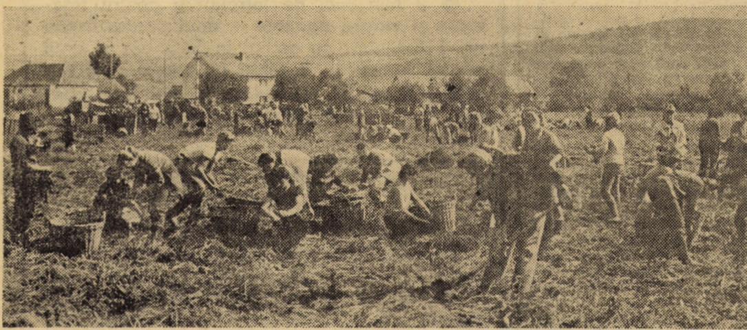
În intervalul 17-29 septembrie a.c. elevii Liceului sanitar din Sibiu au participat activ la stringerea și sortarea producției de morcovi de pe terenurile Fermei nr. 1 Șelimbăr a Asociației economice legumicole Sibiu