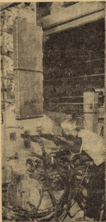
Întreprinderea de geamuri Medias: în imagine, unul din cupoarele de geam tras

În telegrama adresată de Comitetul sindicatului de la I.M. Mirsa se spune: „Dumneavoastră, mult iubite și stimate tovarășe Nicolae Ceaușescu, sinteți, în inimile și conștiința noastră, ale întregului popor ctitorul României socialiste, independente și suverane. Congresul al XIII-lea, reinvestindu-vă în funcția supremă de secretar general al partidului, a validat recunoașterea activității neobosite pe care ați desfășurat-o în fruntea partidului și statului, cu abnegație și pasiune revoluționară, pentru ridicarea patriei pe cele mai înalte culmi de civilizație și progres. Totodată, Congresul a validat opțiunea partidului, a întregului popor pentru continuarea procesului de înflorire multilaterală a României socialiste. Această unanimă și supremă opțiune, cu semnificații deosebite în viața politică a țării, ne dă convingerea, puterea și voința de a vă urma neabătut, de a munci cu abnegație revoluționară, de a înfăptui istoricele hotăriri adoptate de marele forum al comunistilor. Vă dorim, din toată inima, viață lungă, sănătate, putere de muncă, să ne conduceți pe drumul victorios al socialismului și comunismului”.