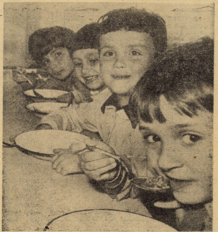
„Cînd sîntem mai mulți — mîncăm mai cu poftă”, „spun” chipurile vesele ale acestor copii dintr-o creșă sibiană.