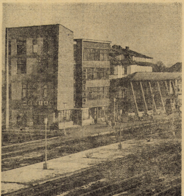
În imagine: poarta feroviară a municipiului de pe Tirnăveni