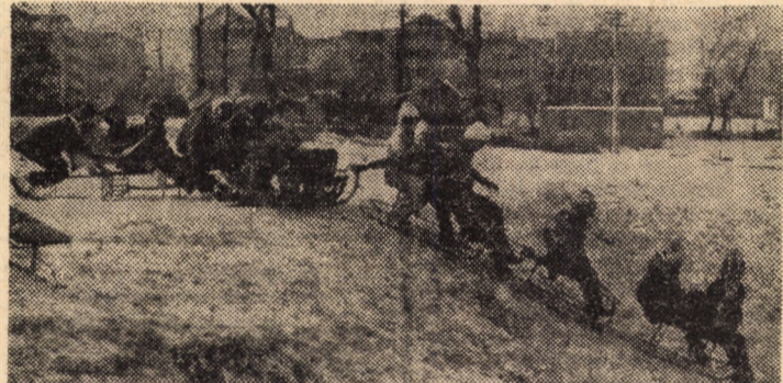
Deși sporadic, multășteptata zăpadă a acoperit, în sfîrșit, derdelușurile din parcurile sibiene.