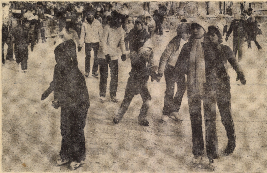
La patinoarul sibian