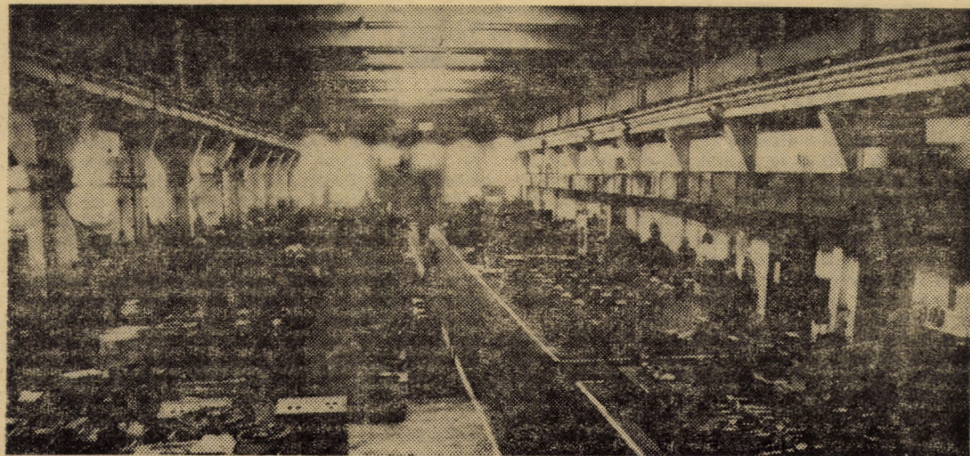
Vedere generală din secția montaj I a întreprinderii „Mecanica” Sibiu

Deci, să reținem, la I.A.S. Nocrich lucrează în momentul de față 11 ingrijitori-mulgători care, în condiții obișnu-