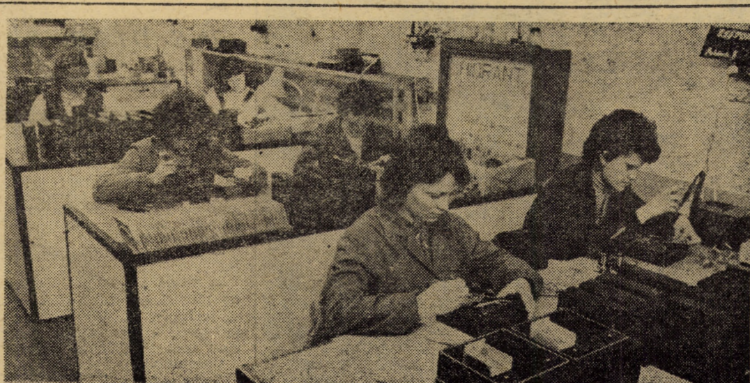
Linie de montaj a voltmetrelor, ampermetrelor și volt-ampermetrelor portabile destinate stațiilor și centralelor electrice, din cadrul atelierului electric montaj aparate de măsură și control al ICEMENERG, filiala Sibiu

(Continuare în pag. a III-a) Nicolae ACHIM