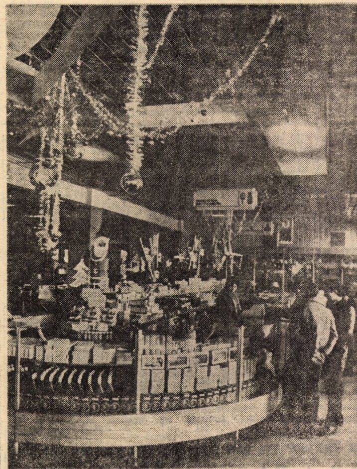
Unul din raioanele magazinului universal „Dumbrava” din Sibiu