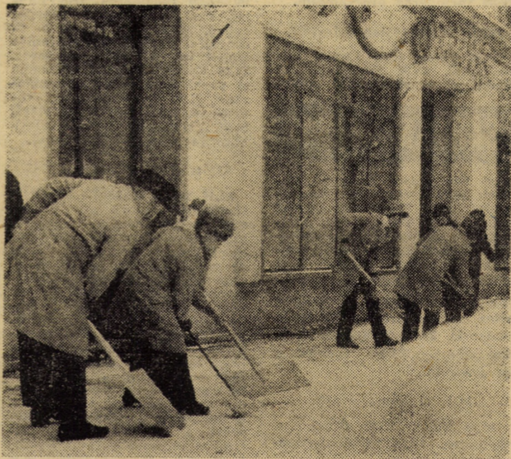
Lucrătorii unităților comerciale își aduc o importantă contribuție la desconggestionarea de zăpadă a trotuarelor

Ninsorile abundente căzute în ultimele zile, vîntul puternic și viscolul au