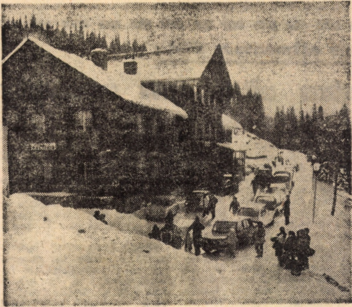
Decor hibernal în frumoasa stațiune Păltiniș

Spectacolele au loc vineri de la orele 11,30, 17,30 și 19,30 și sîmbătă la ora 17,30.