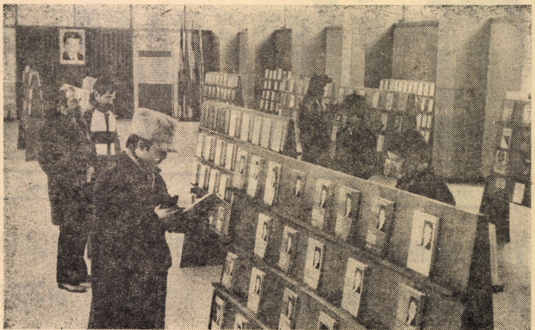
Imagine din Expoziția omagială de carte, consacrată aniversării zilei de naștere a tovarășului Nicolae Ceaușescu, deschisă în sala de marmură a Casei de cultură a sindicatelor din Sibiu.

Petre Diaconu, „Să desifrăm tainele eredității”. Colecția „Știința și tehnica pentru toți”. Seria „Agricul-