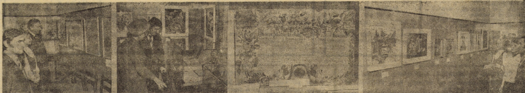
Secvențe din expoziția de artă plastică și carte veche de la Filiala Sibiu a U.S.S.M.