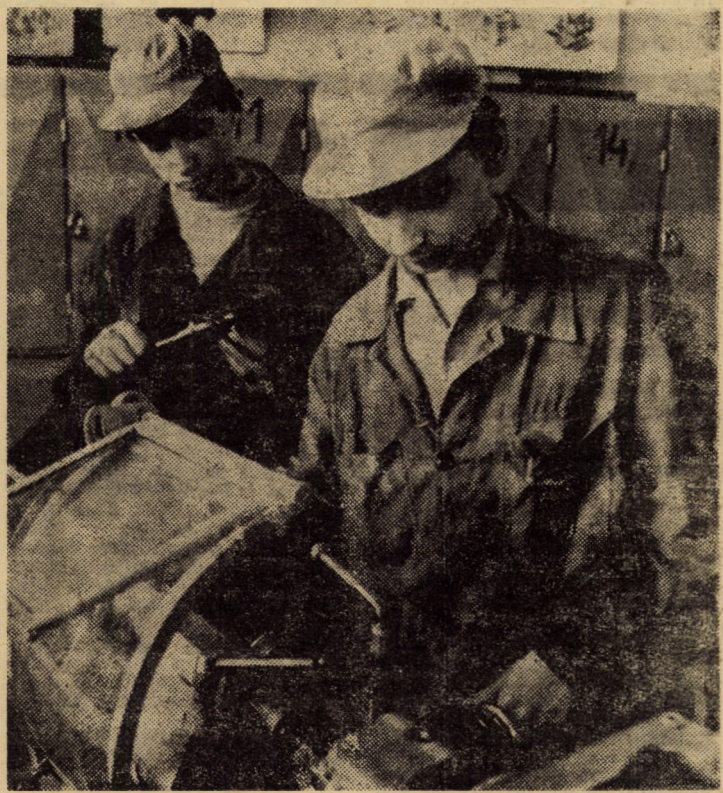
Elevi ai Liceului industrial nr. 3 Sibiu în timpul practicii de producție în atelierul școlii al I.U.P.S. Sibiu

ferme a țaranilor, muncitorilor și intelectualilor din comună de a urma neabătut linia politică a partidului, de a contribui la cimentarea unității poporului în jurul partidului, a secretarului său general, în telegrama Comitetului comunal Loameș al P.C.R. se arată: „Măreția obiectivelor și tezelor, profunzimea ideilor cuprinse în expunerea prezentată Congresului al III-lea al Frontului Democrației și Unității Socialiste, spiritul lor novator și revoluționar reflectă cu putere gîndirea dumneavoastră creatoare și cutezătoare, mult iubite și stimate tovarășe Nicolae Ceaușescu, omul, comunistul și revoluționarul care întruchipă pentru noi cele mai alese virtuți ale întregului popor, stegarul cu o uriașă forță vizionară al întregii politici interne și externe a partidului și statului nostru, politică ce se bucură astăzi de înalta prețuire a întregii lumi contemporane”.