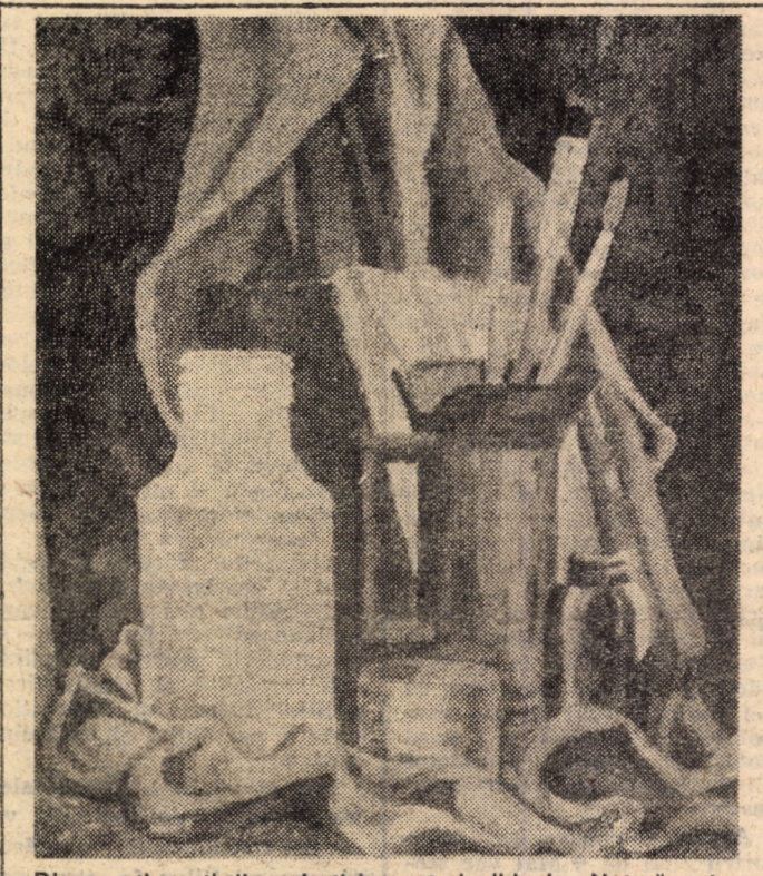
Din creația artiștilor plastici amatori sibieni: „Natură statică” — Bergleiter T.

Dintre preocupările mai recente ale cenaclului de rebus și umor „Metamorfoza” reținem pentru începutul lunii