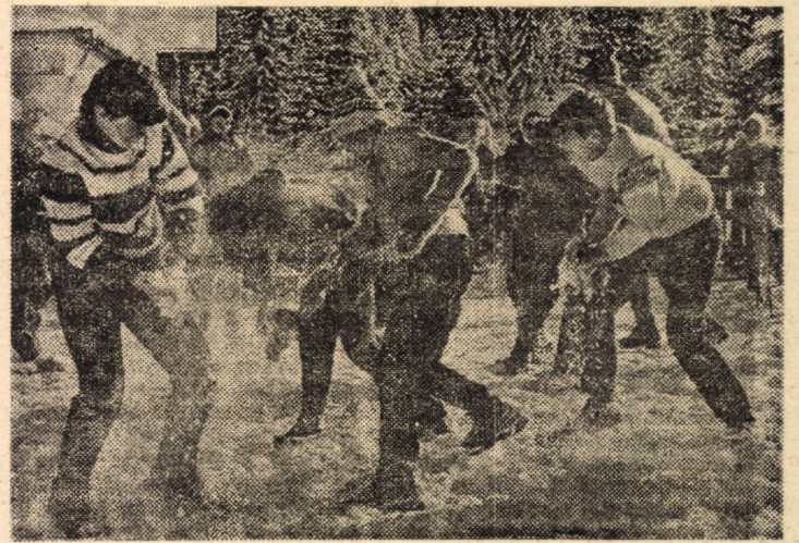
Păltinișul — o adevărată oază de sănătate și frumos!