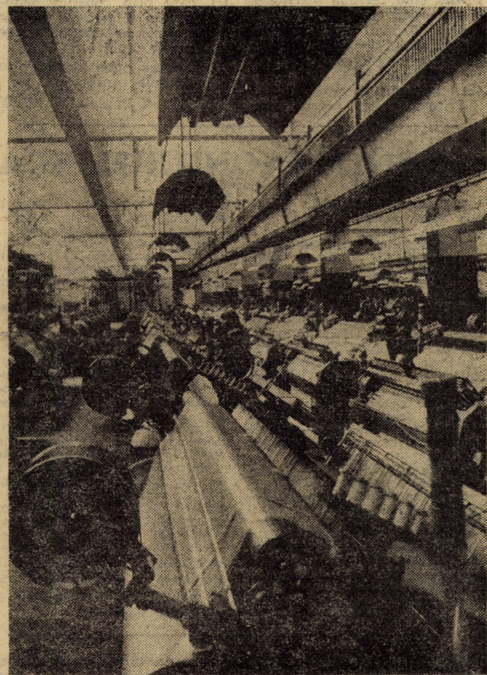
Hala mașinilor de țesut a întreprinderii „Mătasea roșie”, Cîsnădie — unitate reprezentativă pentru industria orașului

Președintele Nicolae Ceaușescu a subliniat că în prezent este necesar să fie intensificate acțiunile politice și diplomatice pentru a se ajunge la o soluție pe cale politică, la o pace justă și durabilă în Orientul Mijlociu, bazată pe retragerea trupelor israeliene din teritoriile arabe ocupate în urma războiului din 1967, pe recunoașterea dreptului poporului palestinian la autodeterminare și la crearea unui stat propriu, independent, pe asigurarea independenței, suveranității și securității tuturor statelor din această regiune.