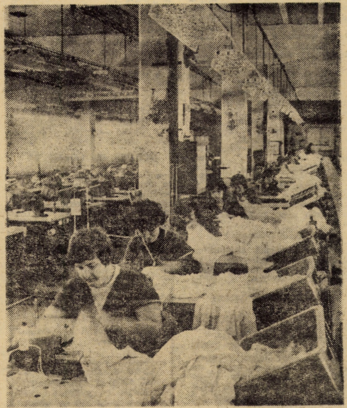
Realizări de seamă între cele două legislaturi: modernizarea locurilor de muncă de la întreprinderea „Drapelul roșu” Sibiu, de unde vă prezentăm o linie de deservire automată

Luînd cuvîntul, tovarășa Elena Nae a mulțumit tuturor celor care au susținut candidatura sa, exprimîndu-și ferma convingere că oamenii muncii din circumscripția electorală M.A.N. nr. 8 Avrig vor milita neabătut, prin demne fapte de muncă, pentru realizarea exemplară a sarcinilor ce le revin în etapa actuală. Tovarășea Elena Nae a asigurat participanții la adunare că va depune întreaga sa capacitate și putere de muncă pentru ca județul Sibiu să poată raporta conducerii partidului, tovarășului NICOLAE CEAUȘESCU, rezultate remarcabile în toate domeniile de activitate, cinstind astfel marea eveniment politic de la 17 martie — alegerile de deputați în organul legislativ al țării și în consiliile populare.