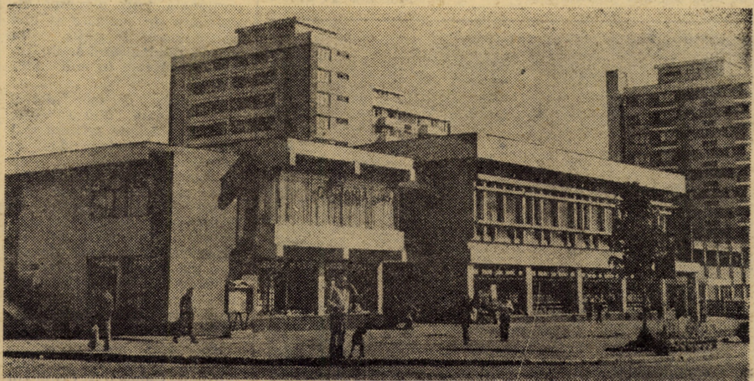
În imagine complexul comercial de pe strada Kolarov, o unitate frecventată zilnic de mii de cetățeni ai Sibiului.

(Continuare în pag. a III-a) Lucian JIMAN