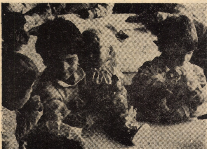
O recentă imagine de la Grădinița nr. 7 Cisnădie, unde „micuții meșteri mari” desfășoară o activitate asiduă.