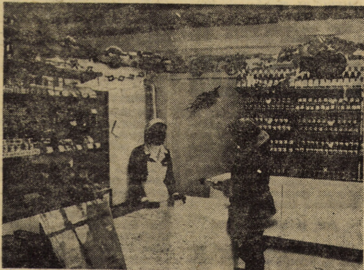
Realizări de seamă între cele două legislaturi: Pe harta județului nostru, recent, a apărut și la Ațel un complex comercial modern, de unde vă prezentăm raionul alimentară.

● Față de anul precedent, în 1984 producția livrată la export a crescut cu 13 la sută la metro și cu 14 la sută în ceea ce privește valoarea. Producția pentru export a fost constituită aproape în totalitate din țesături celofibră 100 la sută.