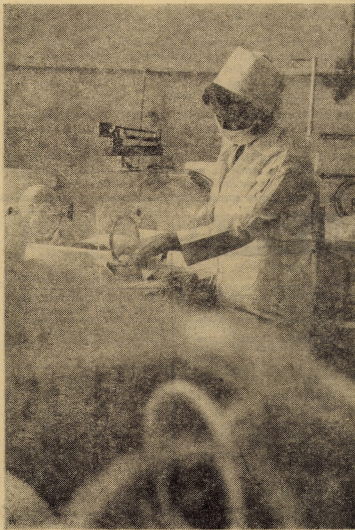
Numeroase unități sanitare din județul nostru au fost dotate, în ultimii ani, cu aparatură modernă. În imagine, vă prezentăm o secvență dintr-o secție a maternității sibiene.

Grație grijii permanente pentru om și bunăstarea sa, țel suprem al politicii partidului și statului nostru în domeniul social, politică ce și-a arătat din plin roadele în perioada care s-a scurs de la Congresul al IX-lea al partidului, perioadă pe care o numim cu profundă stimă și mîndrie patriotică „Epoca Ceausescu”, județul Sibiu a beneficiat în activitatea de ocrotire a sănătății de o permanentă creștere a asistenței medicale acordată populației, personalul muncitor din acest important domeniu al vieții sociale acționînd permanent pentru îmbunătățirea indicatorilor demografici și a activității de prevenire și combatere a factorilor ce influențează negativ starea de sănătate. Iată cîteva semnificative împliniri în acest important domeniu al calității vieții, obținute în legislatura 1980—1985.