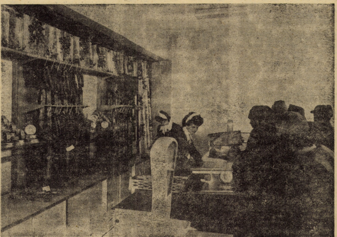
În imagine unitatea alimentară nr. 49 GOSTAT — cartier Vasile Aaron, Sibiu

În cadrul acestui gen de aplicații, o preocupare prioritară a specialiștilor oficiului o constituie încărcarea datelor privind pregătirea tehnică a fabricației pentru toate familiile de produse. Aceasta este problema numărul 1 în ordinea priorităților. Fără ea nu se poate vorbi de o informatică eficientă. Însăși conducerea întreprinderii insistă asupra acestui domeniu, știindu-se că informatica, reprezentînd un important instrument al conducerii, poate asigura la nivelul organelor de decizie, informații și variante pentru urmărirea operativă a costurilor, încărcarea capacităților, asigurarea necesarului forței de muncă, și în alte domenii de pregnant interes.