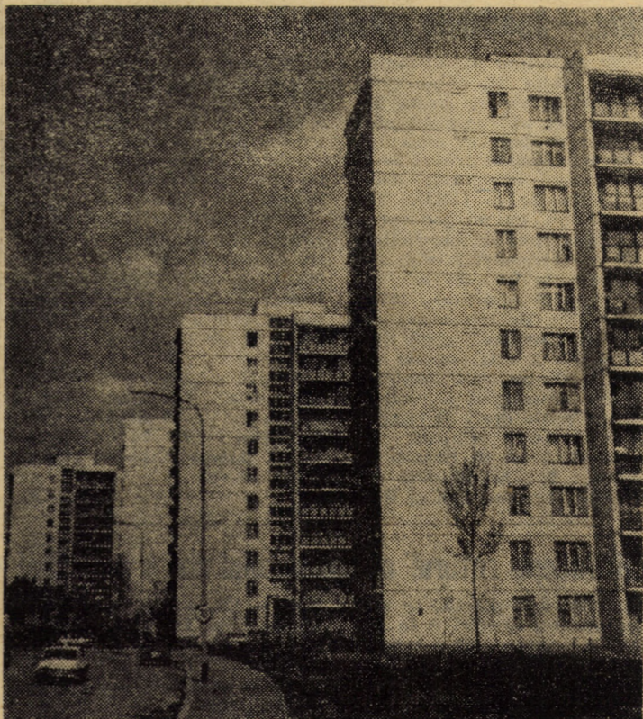
Municipiul Sibiu a cunoscut, cu deosebire în ultimele două decenii, o importantă dezvoltare a construcțiilor de locuințe. În imagine, blocuri din cartierul Hipodrom III

Campania Je fătări la ovine se află în plină desfășurare. Din datele furnizate de Direcția agricolă a județului rezultă că planul pe luna februarie a fost îndeplinit în proporție de 104 la sută — 101 la sută în întreprinderile agricole de stat și 106 la sută în cooperativatele agricole de producție. Au realizat planul cooperativatele agricole de producție din Biertan, Mălincrav, întreprinderile agricole de stat Sibiu, Dealul Ocnei, Mediaș și altele.