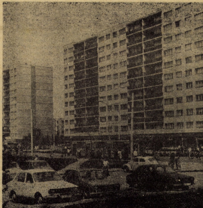
Bulevardul Mihai Viteazul din cartierul Hipodrom III Sibiu, expresie elocventă a dezvoltării municipiului în ultimii ani.