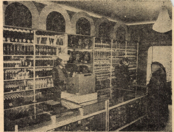
Vă prezentăm unitatea de parfumerie „Crisantema” (în noul local de pe strada Nicolae Bălcescu din Sibiu).

Astăzi, ora 18,30, clubul de jazz al Casei de cultură a științei și tehnicii pentru tineret din Sibiu prezintă, în cadrul celei de a 316-a temă, un mănunchi de dedicații muzicale selectate pe baza preferințelor membrilor clubului. Prezintă Emilian Tantană și prof. Nicolae Ionescu.