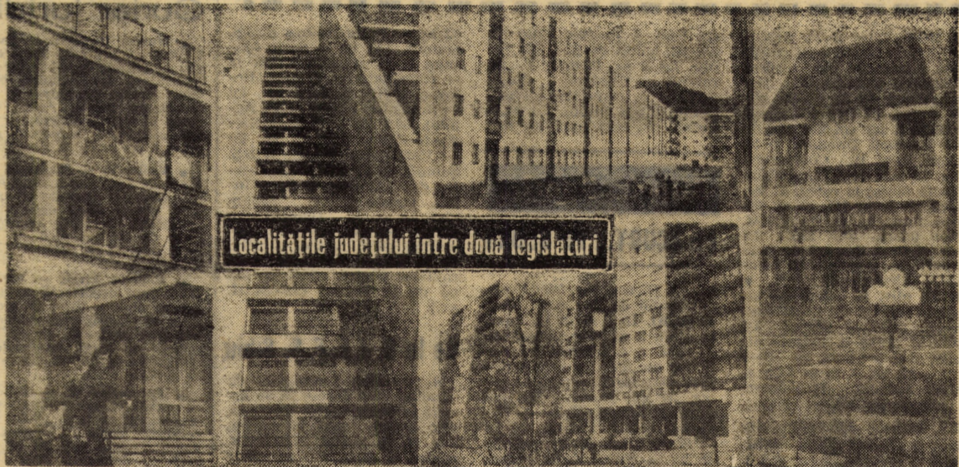
Localitățile județului între două legislații