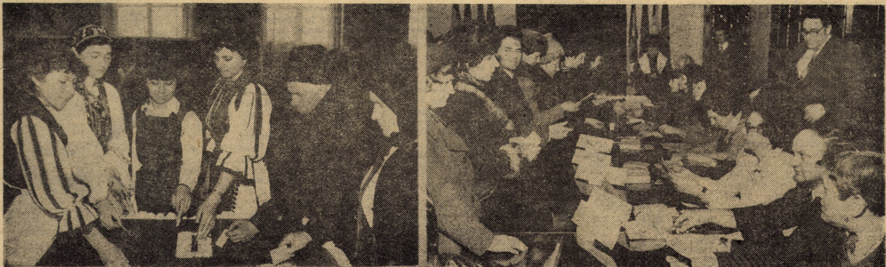
Sub semnul angajării și responsabilității civice locuitorii județului nostru au votat cu vibrantă încredere candidații Frontului Democratice și Unității Socialiste