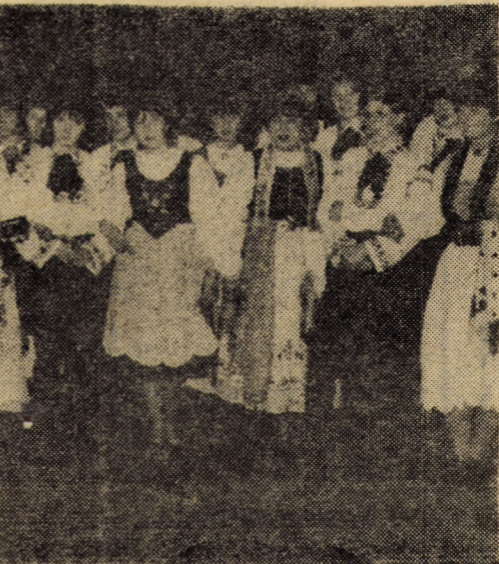
au omagiat ziua de sărbătoare a alegerilor ente cultural-artistice