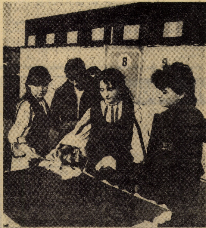
Primul vot — legămînt pentru viitorul luminos al patriei