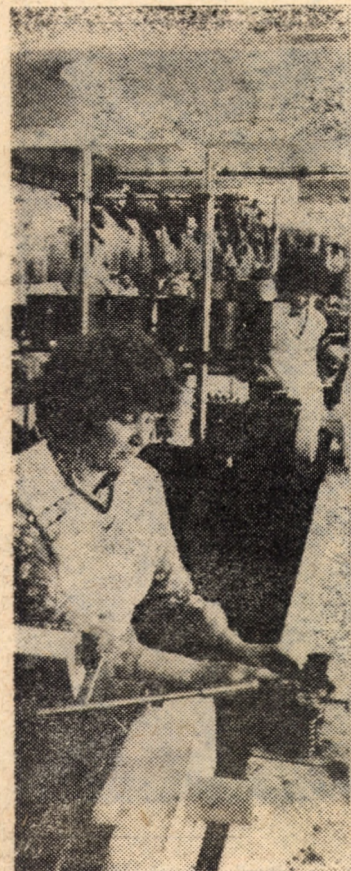
O recentă imagine din secția bobinat a întreprinderii de rele Mediaș.

24.III.1985 • „Cîntul, jocul, veselie ne-nsoțesc copilăria” este genericul sub care se va desfășura duminica cultural-sportivă la care vor participa pionierii din unitatea Școlii generale nr. 5 Sibiu. • La CPSP Copșa Mică va avea loc o masă rotundă cu tema „EPOCA CEAUȘESCU, douăzeci de ani de împliniri”. Participă pionierii membri ai clubului de dezbateri politico-ideologice.