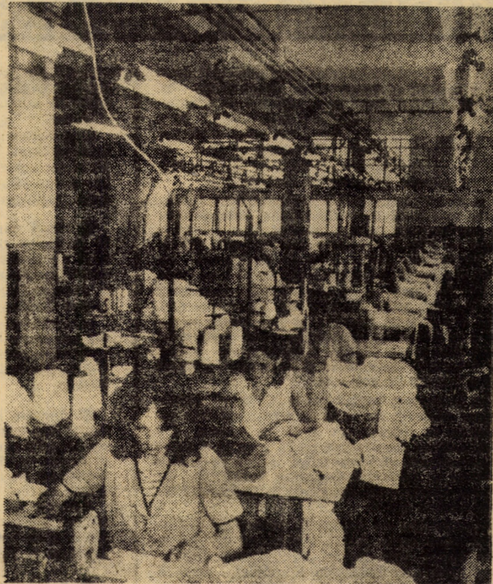
Secvență cotidiană de muncă într-unul din atelierelor întreprinderii „7 Noiembrie“ Sibiu