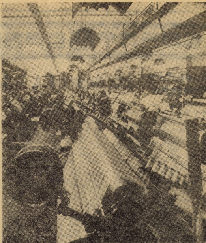
Printre unitățile industriale ale orașului Cisnădie, a căror faimă este binecunoscută în privința calității produselor expediate la beneficiari se află și „Mătasea roșie”. Vă redăm o imagine din atelierul mașini de țesut