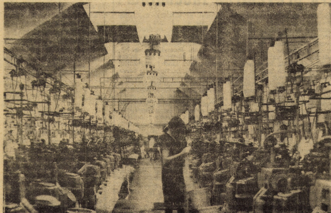
O imagine simbol pentru dezvoltarea industriei textile sibiene: hala mașinilor de tricostat ciorapi de la întreprinderea „7 Noiembrie” Sibiu