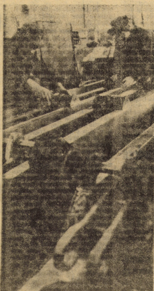
Acordînd în permanență o atenție deosebită îmbunătățirii calității produselor, harnicul colectiv de muncitori al I.U.P.S. Sibiu asigură azi o gamă bogată de utilaje competitive pe piața internă și externă