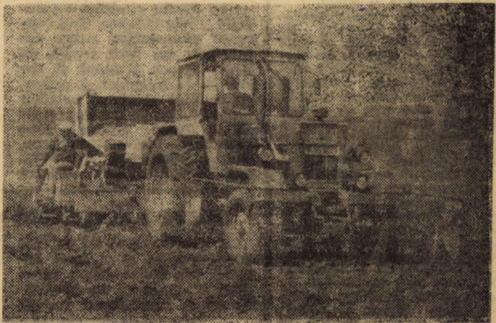
În unitățile cooperatiste din C.U.A.S.C. Tălmaciu plantatul cartofilor de toamnă a intrat în cote finale. Pînă în dimineața zilei de 9 aprilie din programul de 256 hectare s-au realizat 236 hectare. Din calcule rezultă că în cursul zilei de astăzi lucrarea se va încheia