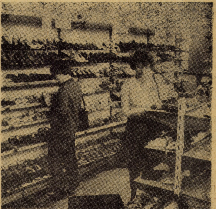
În imagine, interiorul magazinului de încălțăminte din Copșa Mică.