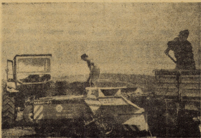
În cooperativele agricole de producție din Avrig, Arpașu de Jos, Cîrța, Cîrțișoara, unități specializate în cultivarea cartofilor, plantatul se execută pe ultimile hectare.