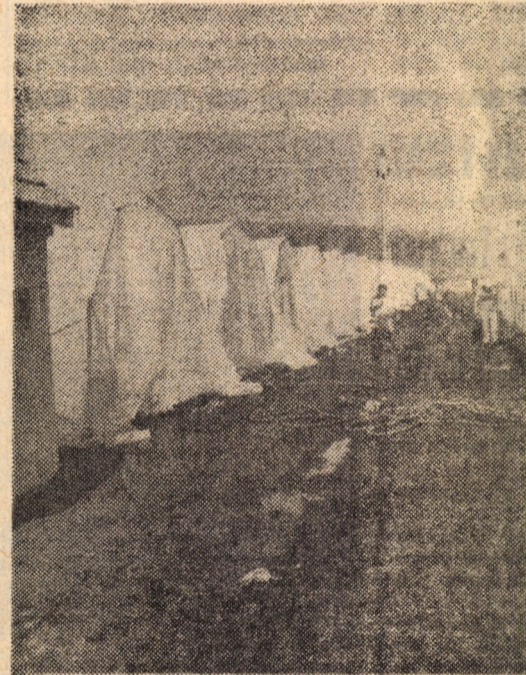
În majoritatea celor 25 de solarii amenajate la I.A.S. Agnita, au fost cultivate deja legumele stabilite în programul acestei primăveri

Privind această microfermă, în care fiecare lucrător își are rolul său bine stabilit, observînd cum se desfășoară activitatea cotidiană, ai imaginea firească a adevăratei chibzuințe gospodărești, a lucrului temeinic făcut. Și pentru că toate acestea sînt argumente ale vredniciei unui colectiv omogen, pentru care prestațiile de calitate sînt ridicate la rang de cinste, să mai menționăm că în cinstea zilei de 1 Mai, din aceste solarii vor fi livrate fondului de stat primele cantități de legume.