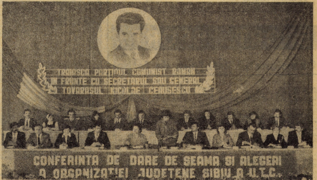
Prezidiul Conferinței organizației județene a U.T.C.