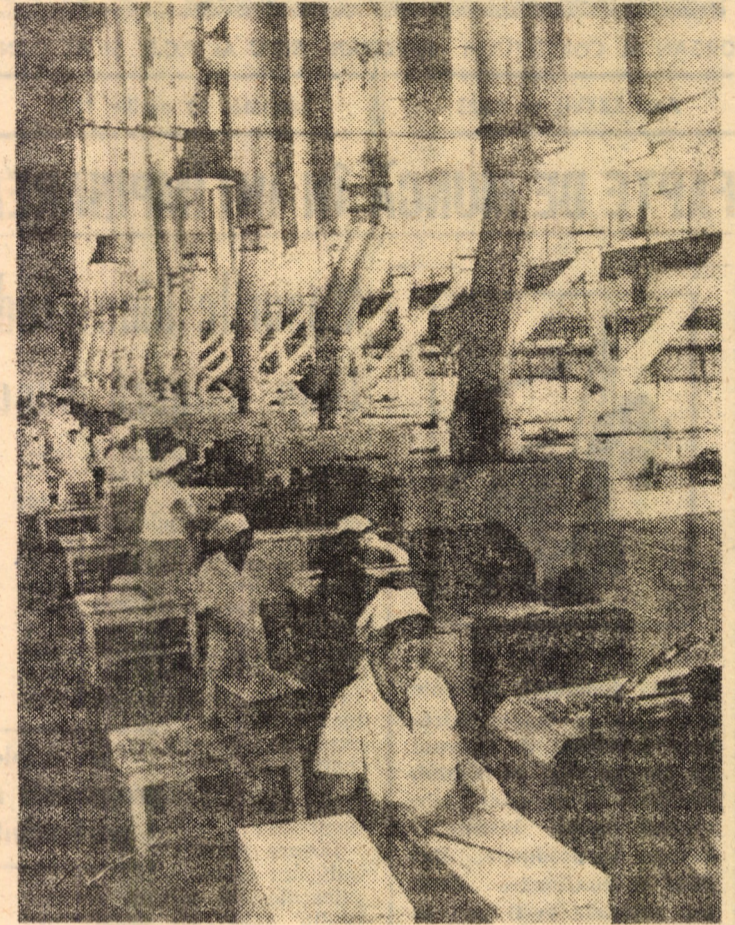
Secvență de lucru la întreprinderea „Victoria” Sibiu

periența cîștigată pe linia creșterii productivității muncii se consolidează și există garanția că ziua de 1 Mai va fi întîmpinată de acest harnic colectiv de muncă cu noi și remarcabile realizări.