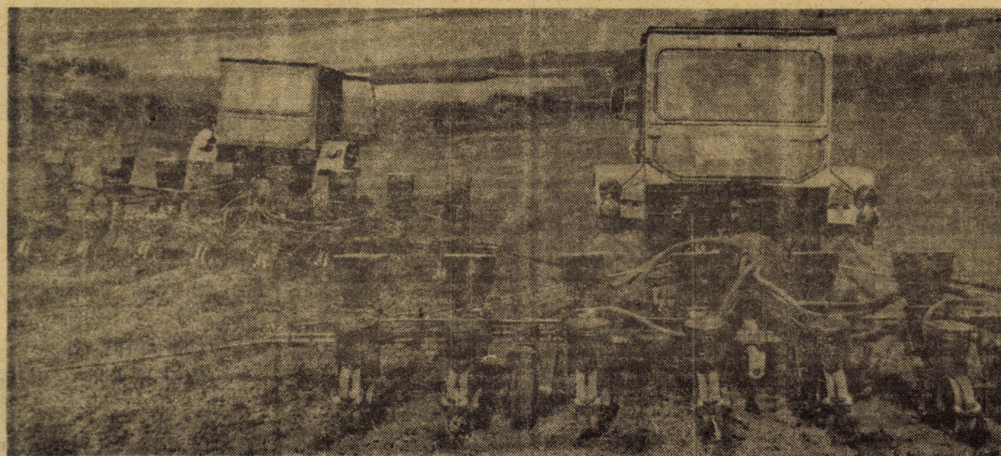
Pentru obținerea unor producții agricole sporite, la C.A.P. Ocna Sibiului, de unde vă prezentăm imaginea de față s-a acordat o atenție deosebită nivelului calitativ al lucrărilor executate. Acest lucru este valabil și în ceea ce privește cultura porumbului, al cărui semănat se desfășoară din plin în aceste zile.