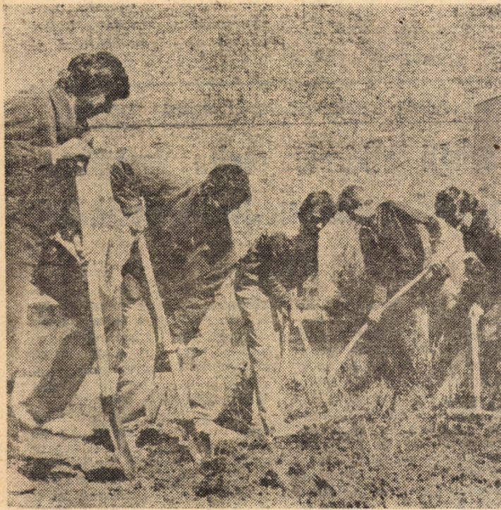
A venit primăvara și, alături de toți locuitorii municipiului Sibiu, studenții se îngrijesc de noua fizionomie a spațiilor verzi din vecinătatea căminelor

Gh. Diaconescu, ș.a., „Tehnologia mecanicii fine și micromecanicii”. Seria „Tehnologia construcțiilor de mașini”. Editura tehnică, 336 pagini. Lei 33.