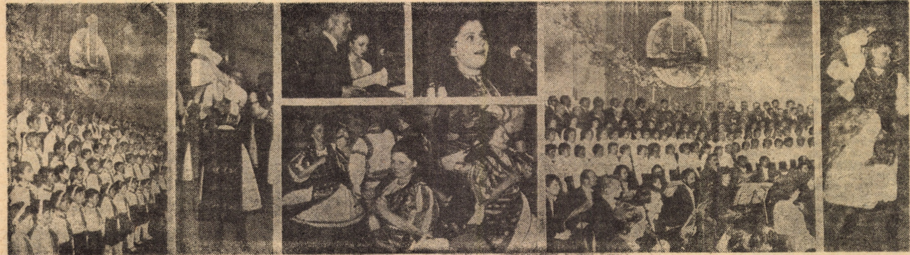
Secvențe din spectacolul omagial

Fornit de la Moscova și avînd punctul terminus la Berlin, raliul automobilistic internațional „Victoria — 40” este dedicat aniversării celor patru decenii de la victoria asupra fascismului. La această întrecere, participă echipaje din U.R.S.S., R.S. Cehoslovacă, R.P. Bulgaria, R.P. Ungară, R.P. Mongolă, R.S. Vietnam, Cuba, R.P. Polonă, R.D. Germană, R.P.D. Coreeană și R.S. România. Azi, 26 aprilie, în jurul orei 14, caravana automobilistică va sosi în Sibiu (cu staționare în parcare din spatele Consiliului popular municipal). Participanții la raliu se vor întîlni, la Casa armatei, cu veterani ai războiului antifascist.