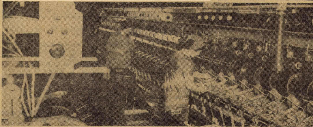
Întreprinderea „Libertatea” Sibiu secvență de muncă, de la pregătirea țesăturii