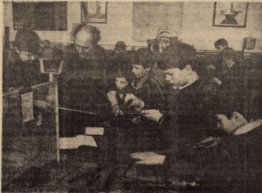
Viiitorii muncitori de înaltă calificare, față în față cu... tainele meseriei. Secvență din atelierul de lăcătușerie al Școlii generale nr. 18 Sibiu

Cunoscînd aceste deziderate, în pagina de față ne-am propus să relatăm din experiența școlii generale și licee din municipiul Sibiu privind orientarea școlară și profesională, activitate desfășurată, după cum spuneam, sub directa conducere și îndrumare a organelor și organizațiilor de partid.