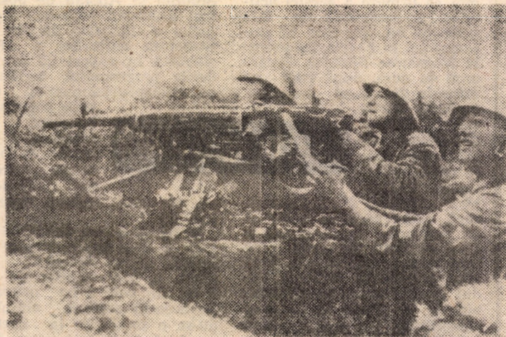
Ostași mitralieri în timpul luptelor pentru eliberarea părții de nord a Transilvaniei.