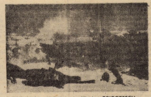
Atacul de la Smirdan — Nicolae GRIGORESCU