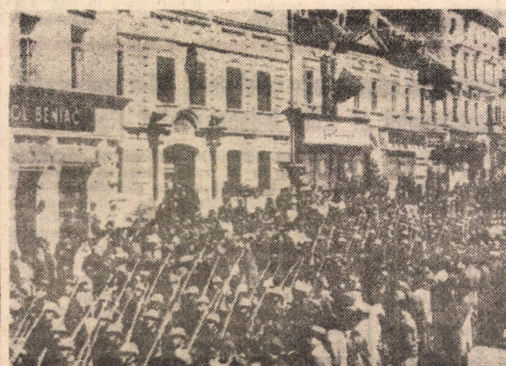
Unitate română trecind prin Banská Bystrica după eliberarea orașului.