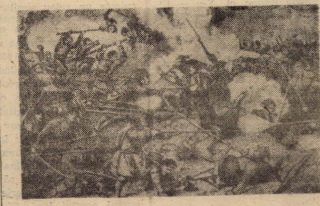
Asaltul de la Grivița — 1877