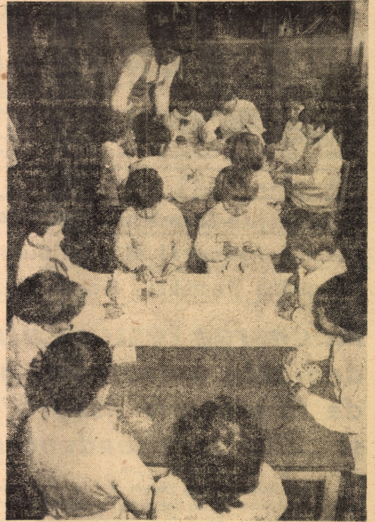
De o bună îngrijire și îndrumare de partea profesorului didactic se bucură copiii cooperanților din comuna Poplaca. Grădinița — de unde vă redăm o imagine — cuprinde azi peste 120 copii