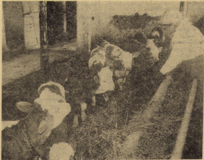
În vederea realizării efectivelor de bovine planificate, la C.A.P. Cristian se acordă o atenție deosebită, așa cum relevă și imaginea de față, creșterii și îngrijirii taurinelor.

dr. I. MĂRGINEANU medic primar la circumscripția veterinară Sibiu