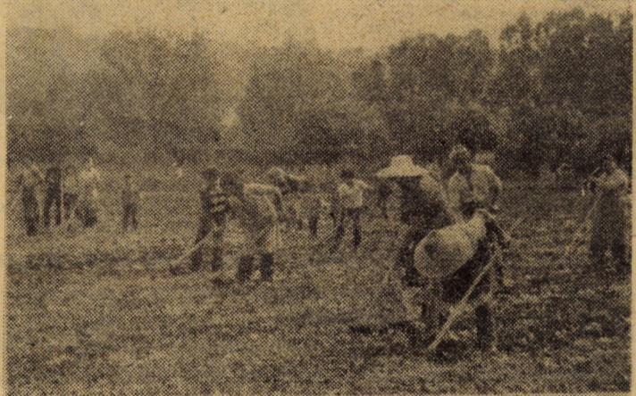
Lucrările de întreținere la sfecla pentru furaje se desfășoară cu intensitate maximă. La I.A.S. Dealul Ocnei sint antrenați zilnic la această lucrare zeci de persoane.

Se apropie de final prașila 1 la sfecla de zahăr. Până în dimineața zilei de 15 mai, lucrarea a fost executată pe 1432 hectare, ceea ce reprezintă 65 la sută din program. Au încheiat lucrarea cooperativele agricole de producție din Alma, Ațel, Ghijasa de Sus, Valea Viilor, Ruși.