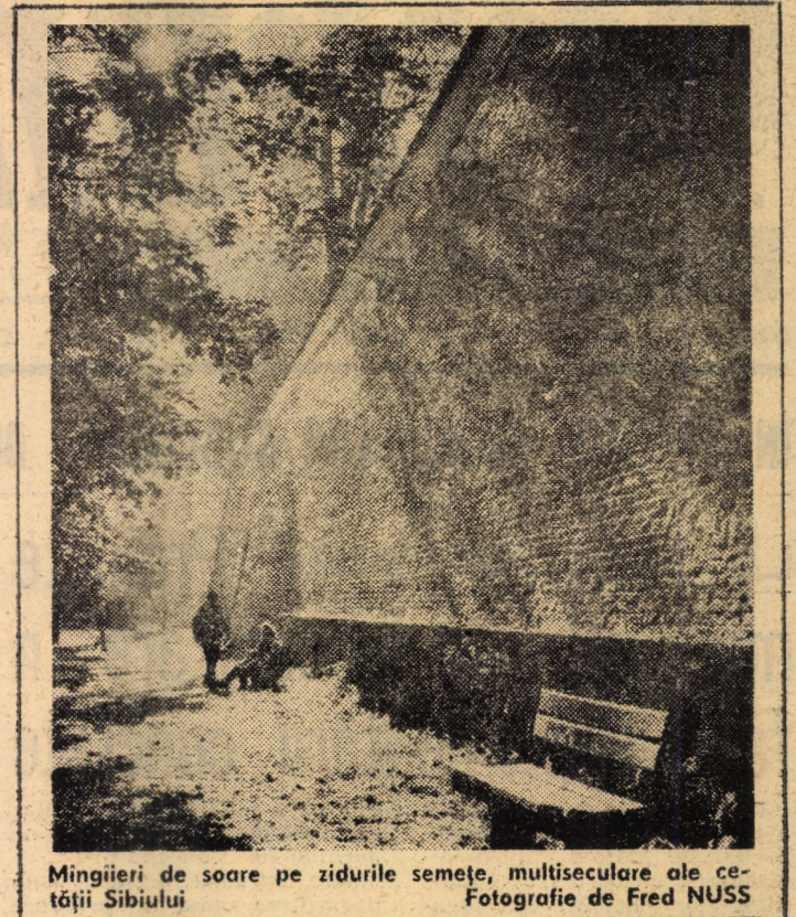
Mingii de soare pe zidurile semețe, multisekulare ale cetății Sibiului