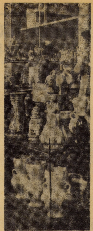
Raionul cu articole de sticlărie, porțelan și ceramică al magazinului universal „Dumbrava” din Sibiu — unul din locurile cel mai des vizitate de cumpărători pentru frumusețea și diversitatea produselor oferite aici