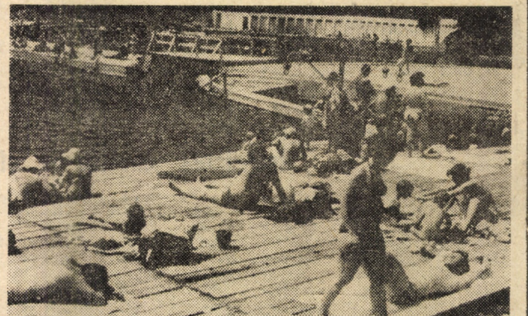
Fotografie de sezon din stațiunea balneară Ocna Sibiului.

tru toți copiii lumii”. „Sintem prietenii cu toți copiii lumii”, etc. — acțiuni dedicate Zilei internaționale a copilului și Anului Internațional al Tineretului.