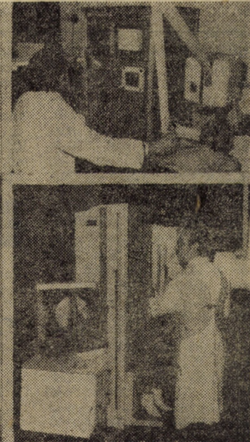
Imagini elocvente pentru înaltul nivel de dotare de care beneficiază astăzi întregul sector medical