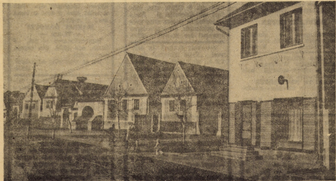
Cristian — una din comunele bine gospodărite din județul Sibiu

Forță de muncă există, prioritățile sînt multiple și se succed rapid. De aceea, se impune o mai bună organizare a întregii activități din cîmp, după programe de lucru întocmite cu chibzuință de adevărați gospodari, la sfîrșitul fiecărei zile de lucru.