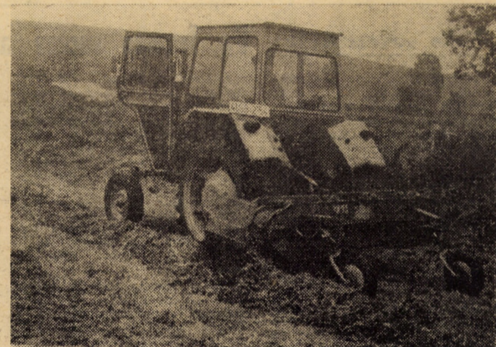
După recoltarea masei vegetale, care va fi conservată sub formă de fin, trebuie să se acționeze imediat pentru uscarea, ridicarea din brazdă și depozitarea corespunzătoare a acesteia

(Continuare în pag. a III-a) Nicolae IVAN