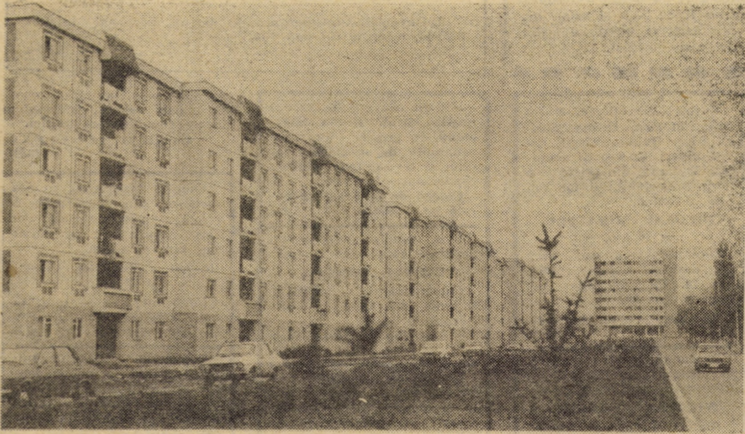
Municipiul Sibiu a cunoscut, cu deosebire în ultimile două decenii, o importantă dezvoltare a construcțiilor de locuințe. În imagine: noi blocuri pe str. Școala de înot din localitate